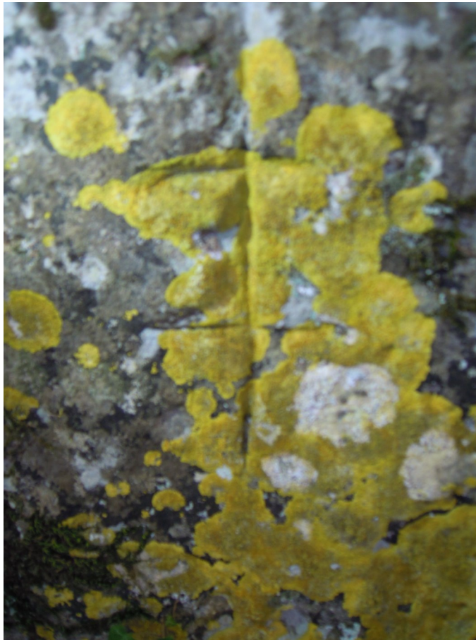
La croix de Lorraine